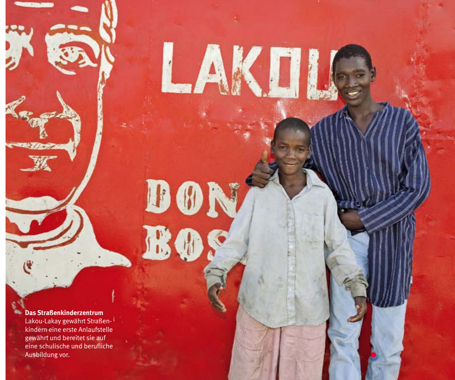
Das Straßenkinderzentrum Lakou-Lakay gewährt Straßenkindern eine erste Anlaufstelle gewährt und bereitet sie auf eine schulische und berufliche Ausbildung vor.