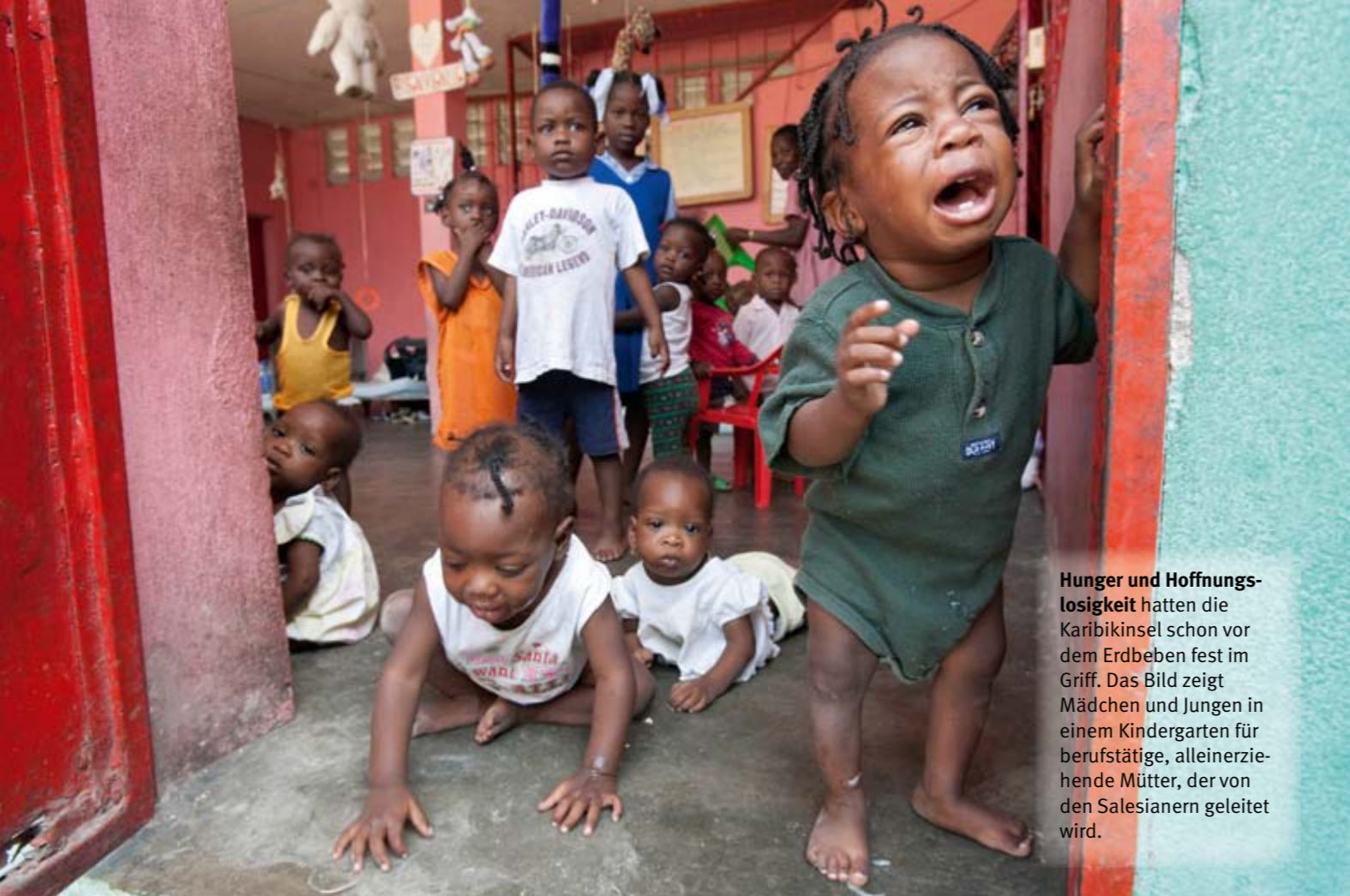
Hunger und Hoffnungslosigkeit hatten die Karibikinsel schon vor dem Erdbeben fest im Griff. Das Bild zeigt Mädchen und Jungen in einem Kindergarten für berufstätige, alleinerziehende Mütter, der von den Salesianern geleitet wird.