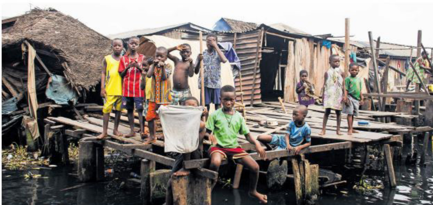
Kinder in Lagos: Die Straßen sind gefährlich für Minderjährige ohne Begleitung.