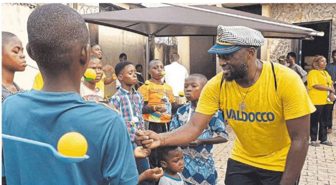
Der Pater und Streetworker bei der Arbeit: Im Kinderschutzzentrum sorgen regelmäßige Feste für Momente der Leichtigkeit, trotz aller Schwierigkeiten

Um den dafür nötigen Zugang zu den Kindern zu bekommen, muss er oft mit deren „Bossern“ verhandeln. Denn viele profitieren auch vom System Straßenkind. „Für diese Leute ist das ihr Geschäft. Und ein Kind, das Hunger hat, ist leicht zu manipulieren“, erklärt der Priester. So werden die Kinder und Jugendlichen eingesetzt, um zu stehlen oder Gewalt zu verbreiten, und bringen Unru-